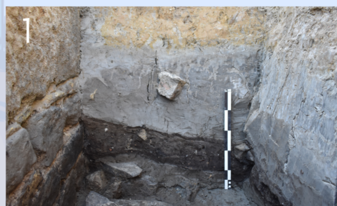
Strati a ridosso della riva