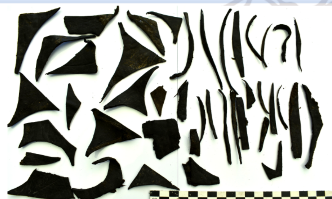
Ritagli di cuoio

Nella fase successiva l'area subisce una completa risistemazione. Al rialzamento della riva segue la posa, nello spazio antistante, di un piano di lavoro in consistente argilla gialla. La struttura muraria viene riutilizzata per la creazione di un grande edificio sviluppato verso sud, che doveva configurarsi come un magazzino con annessa area di servizio. Oltre il waterfront, una fila di grandi buche di palo suggerirebbe la presenza di una zattera lignea protesa sul canale.