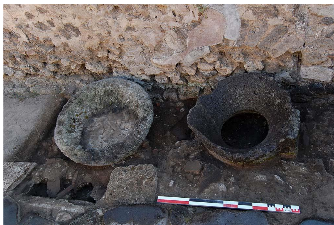
Fig. 3: Pompei, Reg. IX, 5.4. Ritrovamenti in situ.

Attraverso un'analisi approfondita dei Giornali dei Soprastanti conservati presso l'Archivio Storico del Museo Archeologico Nazionale di Napoli, il mio progetto di tesi magistrale mira alla costruzione di un Catalogo contenente tutti i rinvenimenti derivanti dallo scavo dell'Insula. Questa restituisce infatti testimonianze interessanti sia a livello materiale che decorativo, ma tali reperti non furono mai sottoposti ad uno studio sistematico ed esaustivo.