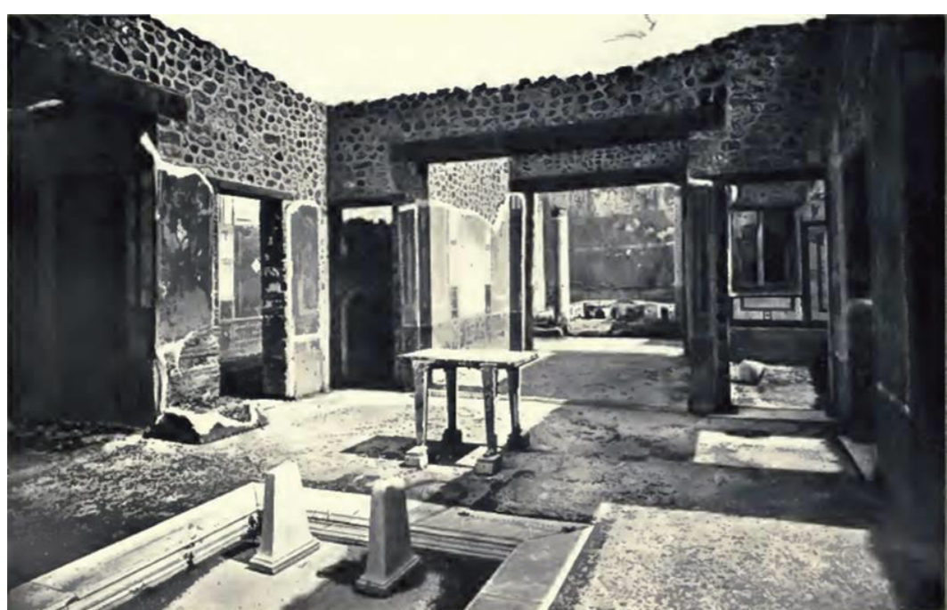
Fig. 2: Pompei, Reg. IX, 5.II. Veduta dell'atrium (1900) © Deutsches Archäologisches Institut.